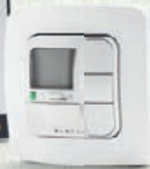
AstroTec-868 1-Kanal-Funkwandsender mit Astro-, Zeit- und Urlaubsfunktion