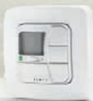
AstroTec-868 1-Kanal-Funkwandsender mit Astro-, Zeit- und Urlaubsfunktion

Sensoren und Zeitsteuerung machen Rollläden intelligent: Sie öffnen und schließen in Abhängigkeit von Wetter und Tageszeit. Bei aktivierter Astrofunktion bewegt sich Ihr Sicht- und Sonnenschutz zu den Sonnenauf- und -untergangszeiten.