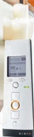
MultiTel 2 Der 15-Kanal-Funkhandsender steuert Rollläden und Sonnenschutz einzeln, in Gruppen oder zentral

Sensoren sorgen dafür, dass Rollläden bei direkter Sonneneinstrahlung heruntergefahren werden: So werden empfindliche Möbel und Pflanzen geschützt.