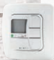
AstroTec Bedrahtete Steuerung mit Zeitschaltuhr und Astroprogramm

Die praktischen Komfort- und Automatikfunktionen erhalten Sie natürlich auch als bedrahtete Steuerungen zur Wandmontage – passend zu den Schalterprogrammen führender Hersteller.