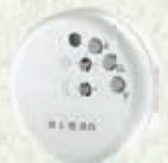
Lumo-868 Funksensor für Licht, Dämmerung und Glasbruch