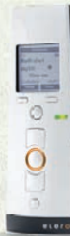
TempoTel 2 10-Kanal-Handsender mit Astro-, Zeit- und Urlaubsfunktion

elero Antriebe mit festen Wellenverbindern erschweren das Hochschieben des Rolladens erheblich. Steuerungen mit Zeitfunktion sorgen dafür, dass Ihre Rolläden abends zuverlässig schließen. Nichts kann vergessen werden. Durch eine optische Anzeige am Sender wird der ausgeführte Befehl für die Bewohner nachvollziehbar – dafür sorgt die bidirektionale Funktechnologie mit Rückmeldung. Bei längerer Abwesenheit aktivieren Sie ganz einfach das integrierte Urlaubsprogramm Ihrer elero Steuerung. Die Rolläden am Haus öffnen und schließen jetzt mit geringer Zeitabweichung – Ihr Zuhause wirkt bewohnt und schreckt potentielle Einbrecher ab.