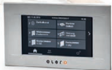
MultiTec Touch-868 Außen edel, innen Hightech: Der Funkwandsender mit 20 Kanälen ermöglicht eine einfache und intuitive Bedienung der Haustechnik über einen hochwertigen Touchscreen